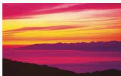
東北発、世界へ。当センターが挑む医療イノベーションの 最前線を、東北各地の美しい景色にのせてお届けします。 表紙：青森県津軽海峡の夕焼け