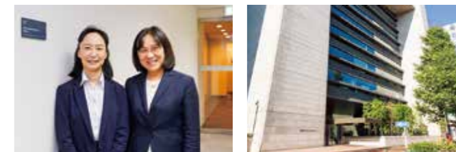
写真左) 国際部門スタッフ / 写真右) CRIETO 東京分室が入る日本橋ライフサイエンスビルディング

2018年 ISO9001:2015 規格の認証を取得。統計解析、データマネジメント、モニタリング、医療情報の4つのグループから成り、治験・臨床試験等の実施計画書や CRF (記録用紙) の作成、患者登録・割付、進捗管理、データ管理、モニタリング、統計解析、総括報告書作成などを通じ、医薬品、医療機器開発を促進します。